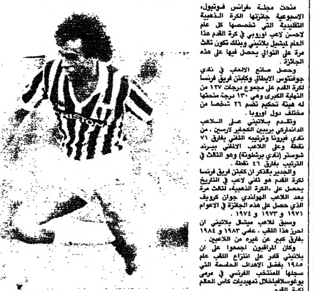
اللاعب ميشال بلاطيني